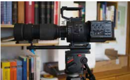
Das „Arbeitstier“ für den Heiligabend: Diese „richtige“ Video-Kamera ist besser geeignet, als mein Fotoapparat, der auch filmen kann.

An den Advents-Sonntagen wird es Probeläufe der Technik geben, die aber nicht veröffentlicht werden. Alle Beteiligten müssen üben. Es wird sicher auch eine Generalprobe stattfinden.