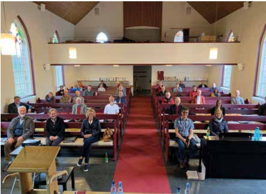
Die Synode versammelte sich am 12. September 2020 in der Salemskirche in Tarmstedt.