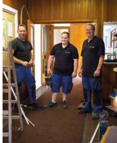
Elektriker der Firma Christens

Neben Größe und Effizienz der neuen Heizgeräte, ist der wichtigste Vorteil, dass sie sich viel leichter und aus der Ferne