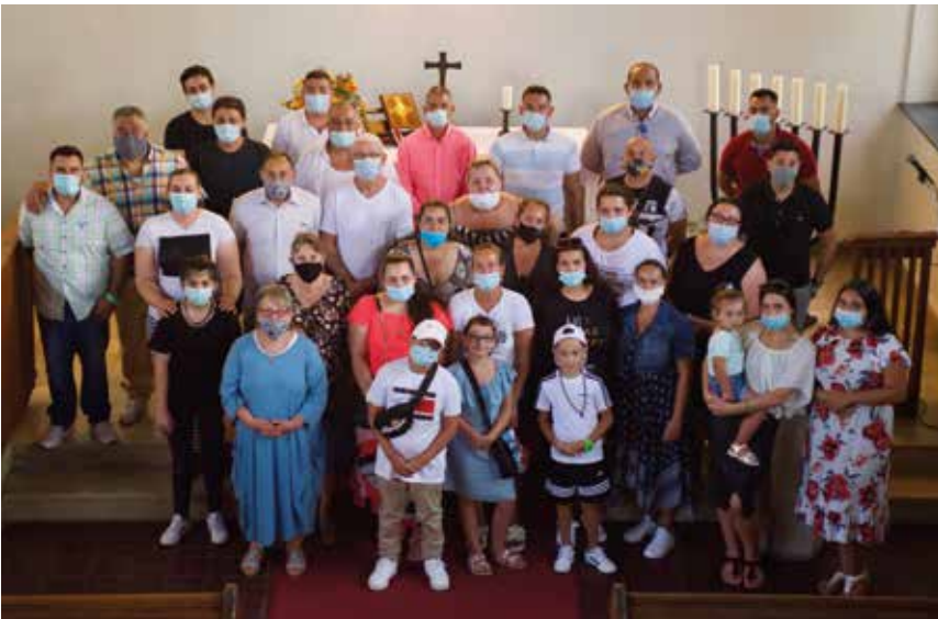
Die Gottesdienstgemeinde des Missionswerkes Zion in unserer Kirche.

Im Gebet verbunden. Missionswerk Zion e.V.